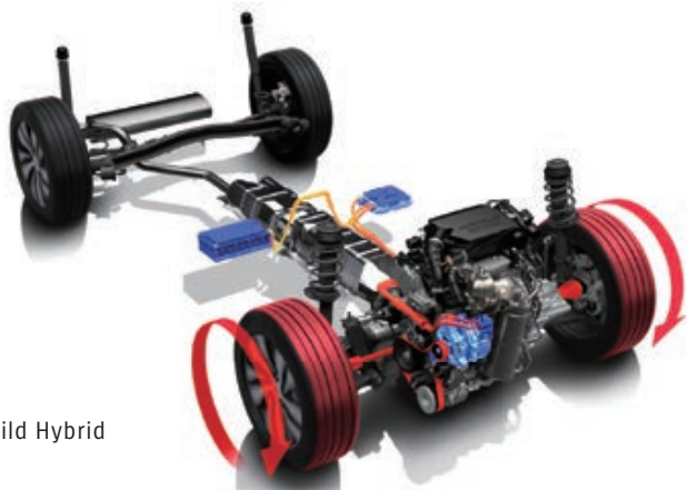
■ Mild Hybrid

Nový 48 V systém SHVS Mild Hybrid pozostáva zo 48 V ISG (integrovaného štartovacieho generátora) s funkciou elektromotora, 48 V lítiovo-iónovej batérie a 48–12 V meniča DC/DC. Vďaka zvýšenému prívodu napájacieho napätia v porovnaní s bežnými 12 V systémami sa zvyšuje množstvo energie rekuperovanej pri brzdení a zároveň miera asistencie elektromotora v záujme znižovania spotreby paliva a optimalizácie jazdného výkonu.